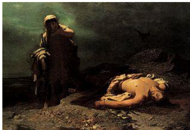
Η Αντιγόνη εμπρός στο νεκρό Πολυνείκη (1865). Λάδι σε καμβά, 100 εκ. x 157 εκ. Εθνική Πινακοθήκη της Ελλάδας - Μουσείο Αλεξάνδρου Σούτζου.