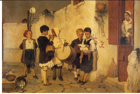
Κάλαντα , 1872