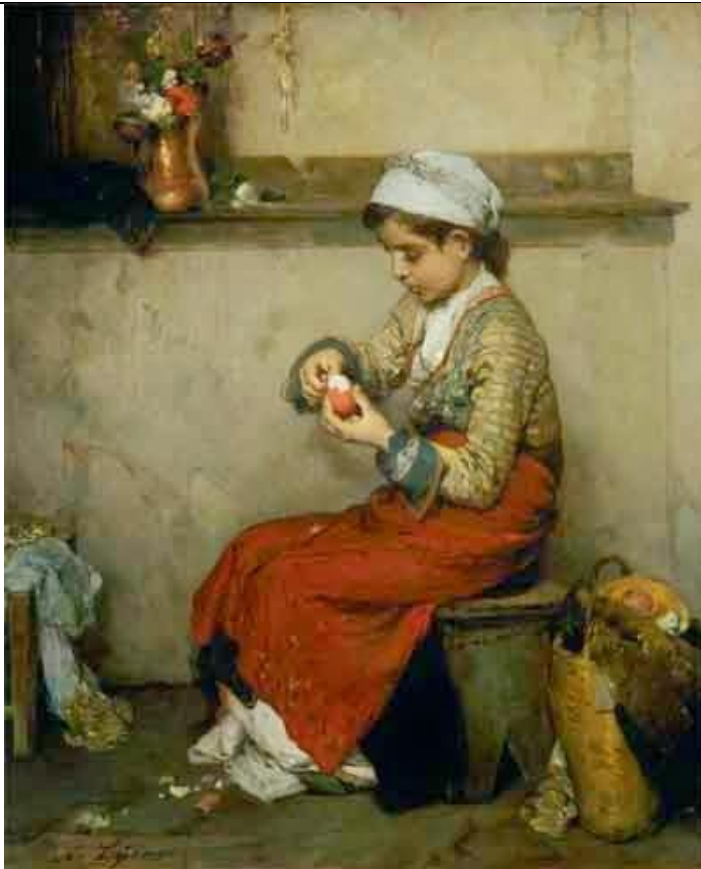
«Το ωόν του Πάσχα», Νικηφόρος Λύτρας