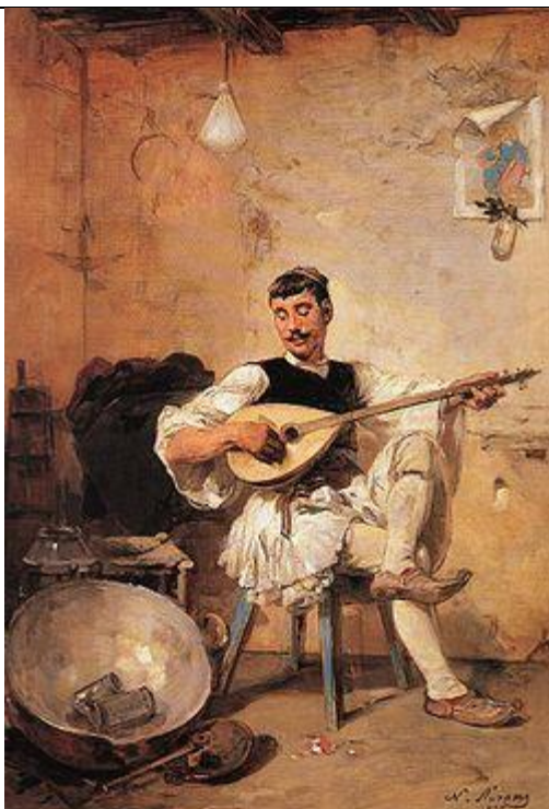
Ο γαλατάς (1895). Λάδι σε καμβά, 53 εκ. x 37 εκ. Εθνική Πινακοθήκη της Ελλάδας - Μουσείο Αλεξάνδρου Σούτζου