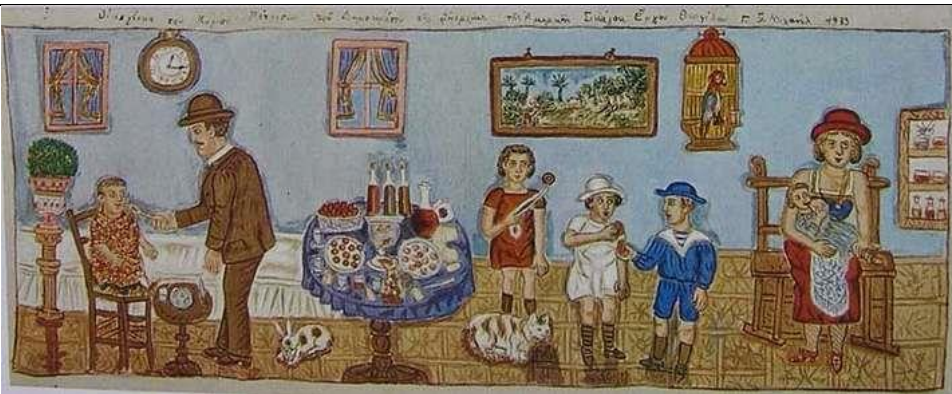
«Οι κουλούρες με τα κόκκινα αβγά, Οικογένεια του κυρίου Πάτρισον από το Σικάγο»- Θεόφιλος

Μπορείτε να παρατηρήσετε τους πίνακες και να βρείτε ομοιότητες και διαφορές ( όσον αφορά τον τρόπο απεικόνισης των προσώπων, τα χρώματα που κυριαρχούν, την σύνθεση).