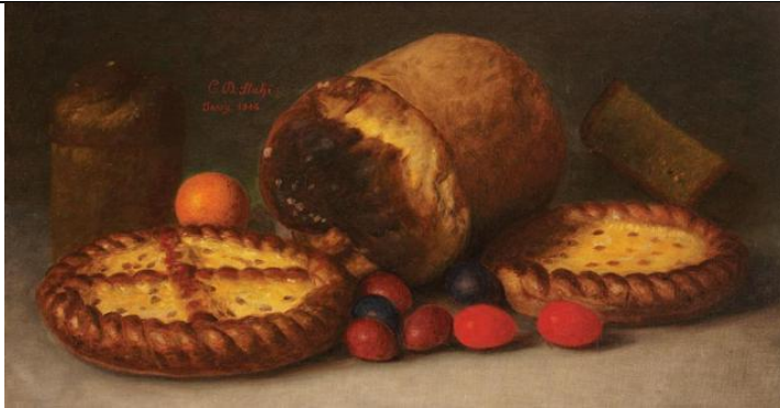
«Πασχαλιάτικο φαγητό», Constantin Stahi