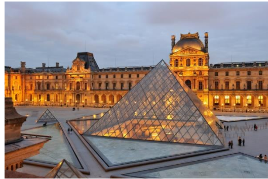
το Μουσείο του Λούβρου στο Παρίσι